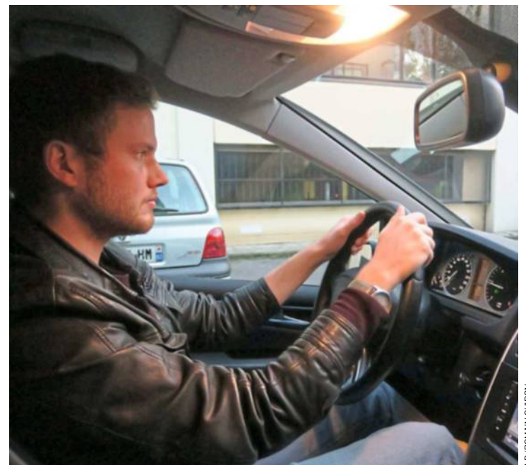
Saint-Ouen (Seine-Saint-Denis). Il aura suffi d'une petite annonce sur Internet pour que notre journaliste se retrouve au volant d'une fausse auto-école.

Avant moi, elle m'assure avoir déjà donné des leçons à trois autres personnes. Parmi elles, « des gens qui ne savaient pas